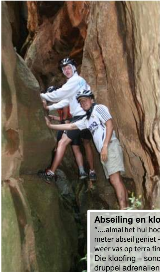
Abseiling en kloofing “....almal het hul hoogtevrees oorwin en die 30 meter abseil geniet – veral nadat die voete weer vas op terra firma was.” Die kloofing – sonder toue – was elke druppel adrenalin werd.