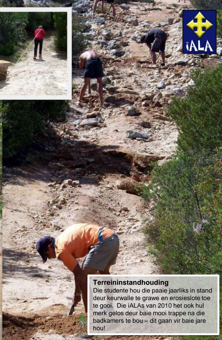
Terreininstandhouding Die studente hou die paaie jaarliks in stand deur keurwalle te grave en erosieslote toe te gooi. Die iALAs van 2010 het ook hul merk gelos deur baie mooi trappe na die badkamers te bou – dit gaan vir baie jare hou!