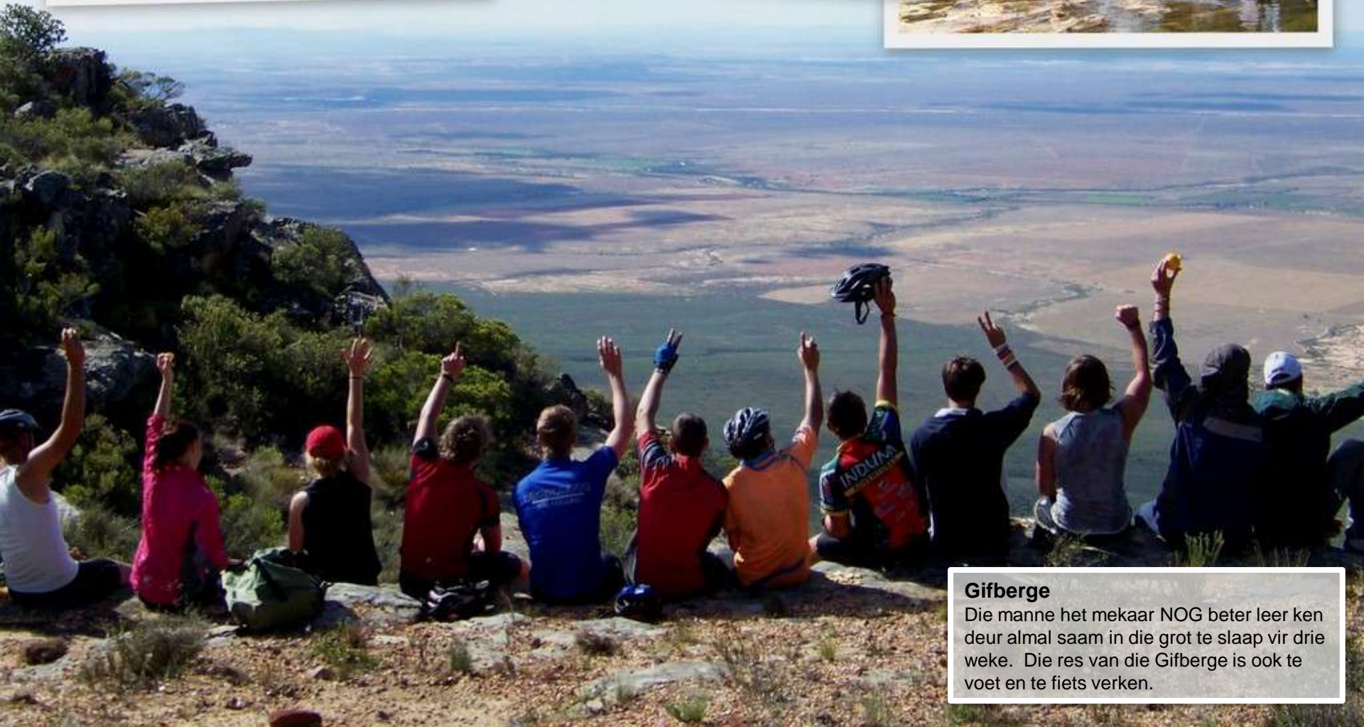
Gifberge Die manne het mekaar NOG beter leer ken deur almal saam in die grot te slaap vir drie weke. Die res van die Gifberge is ook te voet en te fiets verken.